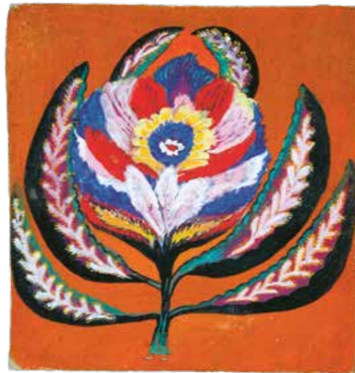
Sofia Homeniuk (1921–2001), Rainbow , 1966, Gouache on paper, RODOVID-Gallery Collection (Kyiv)

Виставка «Звір війни. Наївне мистецтво з України» в open art museum (співкуратор Лідія Лихач, РОДОВІД-Галерея, Київ) вперше представить український наїв у Швейцарії. У центрі – група робіт Марії Примаченко з картиною «Звір війни». Виставка супроводжується каталогом німецькою, англійською та українською мовами.