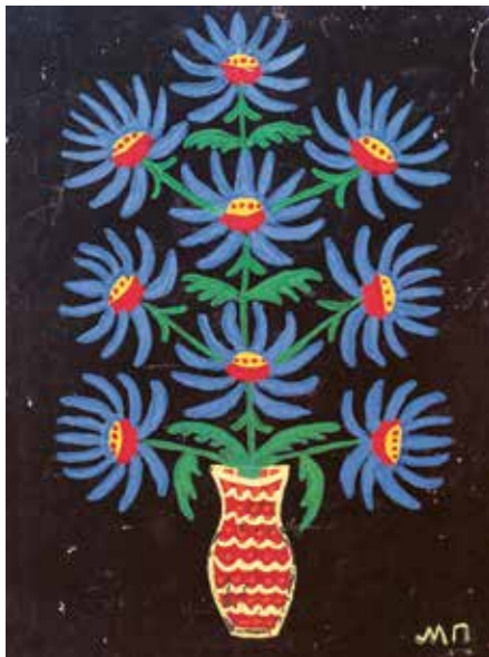
Maria Prymachenko (1909–1997), Flowers on Black , 1960–1970s, Gouache on paper, RODOVID-Gallery Collection (Kyiv)

The exhibition of Naive Art from Ukraine at the open art museum, curated by Lidia Lykhach (RODOVID-Gallery, Kyiv), is the first of its kind in Switzerland. Its central focus is a group of works by Maria Prymachenko, including the painting The Beast of War . An exhibition catalog will be published in Ukrainian, English, and for the first time in German.