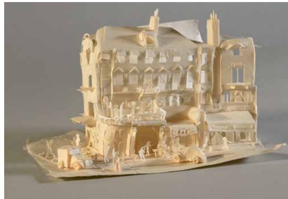
deess (*1977), Kubeis – Kunstwerkstatt an der Lorze, Cham