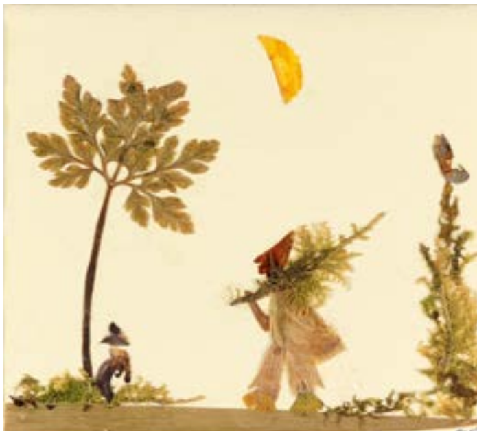
Olga Bücheli (Lebensdaten unbekannt), Ohne Titel (Jäger mit Hund) , 1994, Collage mit getrockneten Blumen, open art museum, Schenkung Hanna Uelliger

Anzahl Kunstschaffende: 14 Anzahl ausgestellter Werke: 52